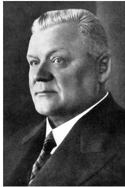
Карлис Улманис Президент Латвии 1936-1940

Сразу после начала революции 1917 года Латвия, Литва и Эстония провозгласили свою независимость; подписали конституции вышли из состава России. Между мировыми войнами Латвия, Литва и Эстония были суверенными. Независимые государства сами решали, что делать. Но вскоре началась Вторая мировая война.