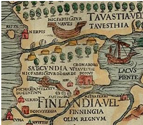
Finland. Medieval Map Финляндия. Средневековая карта

«Граница России нигде не заканчивается!» – так и сказал В.В. Путин 24 ноября 2016 г. во время церемонии вручения награды Русского географического общества 9-летнему мальчику. Церемония транслировалась по телевидению. Путин пошутил с ребёнком, который пытался ответить на вопрос о границах России. Хотя шутка российского президента была непринуждённой, она основана на базе постоянного стремления России включить в своё лоно новые территории. Разные государственные лидеры работали над расширением России в течение веков.