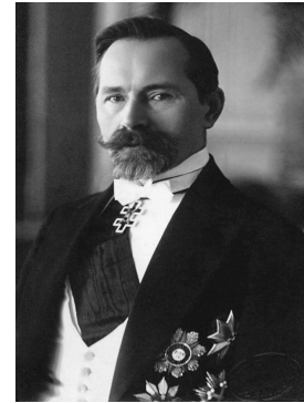
Антанас Сметона Президент Литвы 1926-1940

В августе 1939 года Советский Союз и Германия подписали «Пакт Молотова-Риббентропа», который якобы был договором о ненападении между Германией и Советским Союзом (Йоахим фон Риббентроп и Вячеслав Михайлович Молотов – министры иностранных дел Германии и Советского Союза). акт включал