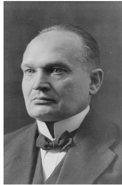
Константин Пятс Президент Эстонии 1937-1940