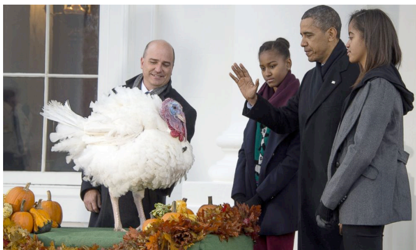
Президент Обама милует индейку, и Малия и Саша Обама наблюдают за этим.

Помилование индеек – добрая традиция по некоторым причинам. Во-первых, американский народ может видеть смешную и благожелательную сторону своего лидера. Людям надо иногда видеть гуманность и человеческие качества людей, которые ими руководят. Во-вторых, эта традиция признает существование одного из самых американских праздников. В-третьих, каждый год две индейки получают пощаду от вкусного, вкусного рока.