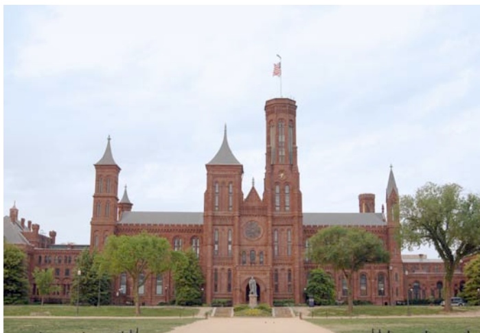
Главное здание Смитсоновского института в Вашингтоне, округ Колумбия

бриллиант в мире, либо старые тапочки бывшего президента. Институт стал называться «чердаком нации», так как с тех пор как он был основан, там собирались экспонаты, связанные со всеми ключевыми моментами истории США. Смитсоновский институт можно сравнить с такими европейскими национальными музеями, как Лувр (во Франции) и Эрмитаж (в России), хотя в Смитсоновском музее есть меньше предметов изящных искусств, чем предметов обихода из жизни человека.