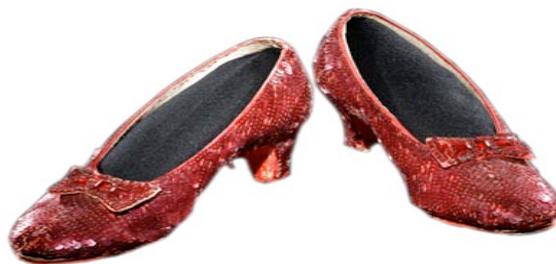
Рубиновые туфли со съемок фильма «Волшебник страны Оз»

Несмотря на то, что первый «секретарь» института Джозеф Хенри хотел, чтобы институт стал центром только для научных исследований, учреждение прежде всего знаменито тем, что оно является хранилищем американских национальных сокровищ. Коллекция музея началась с экзотических объектов, связанных с миром животных и растений, а также разных культур, которые привезли участники кругосветного путешествия в 1842 году. Следуя примеру Смитсона, другие богатые учёные стали завещать свои аппараты и устройства руководству института. Со временем институт приобретал разные объекты: бутафорские материалы с известных голливудских съемок, галереи картин и даже Алмаз Хоупа, самый дорогой и чистый бриллиант в мире.