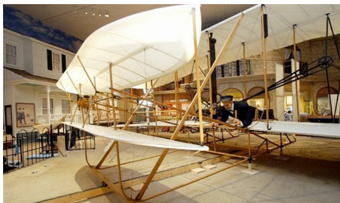
Первые эксперименты в области авиации

Тогда что такое Смитсоновский институт? По закону он является частью американского государства, отдельной от управляющих ветвей власти организацией, так что в общем он финансируется государством для блага народа. Многие американцы знают о главном музее Смитсоновского института в столице, хотя они могут не знать о филиалах института, расположенных по всей стране. Филиалы включают в себя и музеи, и исследовательские центры: например, Национальный музей дизайна, Национальный музей авиации и космонавтики, Гарвард-Смитсоновский центр астрофизики и Национальный зоологический парк.