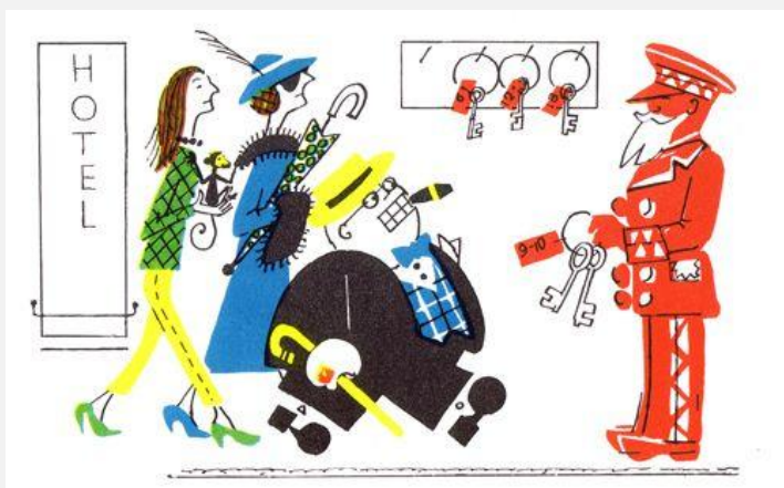
Мистер Твистер, бывший министр и миллионер, с семьей

фотографии американского туриста на Кубе перед революцией; она была сделана кубинским фотографом и напечатана в местной газете. Позже эта фраза была использована как заглавие книги, написанной в 1958 г. о войне во Вьетнаме. В ней описывалось некомпетентное и презрительное поведение американских представителей властей. Интересно то, что некрасивый американец (главный персонаж книги) был скромным инженером, который жил во вьетнамской деревне и учил вьетнамцев современным способам землеобработки и консервированию, но темой книги стало безалаберное поведение американцев, которые представляли правительство США в то время, и когда книга стала популярным фильмом в 1963 г., эта фраза стала употребляться с определённым смыслом.