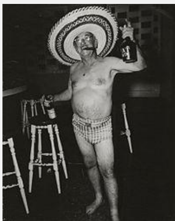
Первый Некрасивый Американец

фотографии американского туриста на Кубе перед революцией; она была сделана кубинским фотографом и напечатана в местной газете. Позже эта фраза была использована как заглавие книги, написанной в 1958 г. о войне во Вьетнаме. В ней описывалось некомпетентное и презрительное поведение американских представителей властей. Интересно то, что некрасивый американец (главный персонаж книги) был скромным инженером, который жил во вьетнамской деревне и учил вьетнамцев современным способам землеобработки и консервированию, но темой книги стало безалаберное поведение американцев, которые представляли правительство США в то время, и когда книга стала популярным фильмом в 1963 г., эта фраза стала употребляться с определённым смыслом.