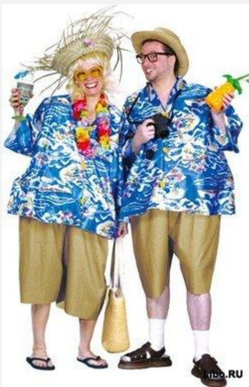
Твистер младший, со своей женой

любил говорить о деньгах и бизнесе, но не о труде, и редко о производстве или земледелии: он предпочитает фондовую биржу и финансовые сделки, что значит, что он опять говорит о деньгах.